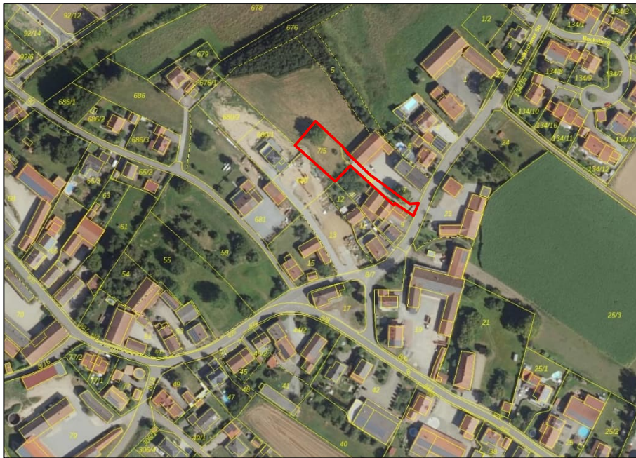
Luftbild mit Plangebiet (rot).

Aufgrund dieser besonderen örtlichen Voraussetzungen befürwortet die Gemeinde Perkam die Ausweisung einer zusätzlichen Bauparzelle im bisherigen Außenbereich nordwestlich der Thalkirchener Straße. Die geplante bauliche Entwicklung ergänzt die bestehenden Siedlungsbereiche im Westen von Perkam in einer städtebaulich vertretbaren Dichte und Struktur.